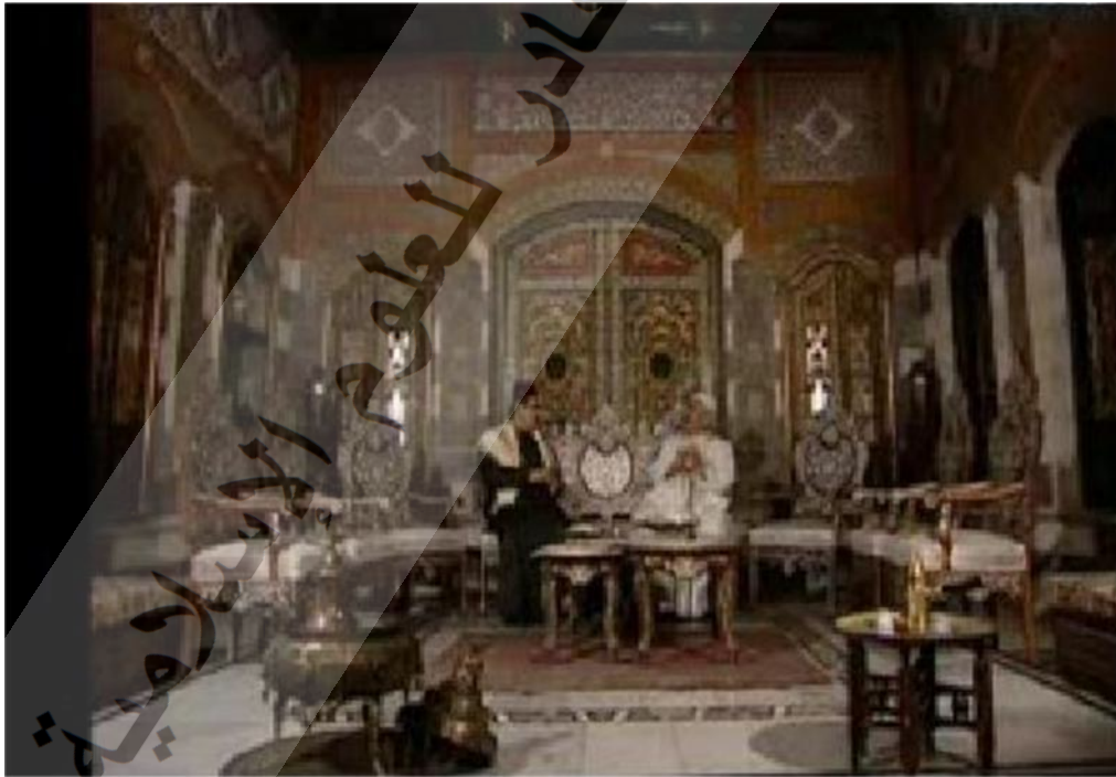
- صورة مستخرجة من المشهد الأول .

صُور هذا المشهد في فضاء داخلي تمثل في غرفة الاستقبال و يظهر زيارة أبو عصام لبيت الزعيم أبو صالح للاتفاق حول جمع الأموال و اشتراء السلاح للإخوة الفلسطينيين، وقد أبرزت اللقطة الموظفة تفاصيل ديكور هذا المكان والتي تمثلت في أرضية منقسمة إلى قسمين قسم مرتفع عن أرضية الغرفة ويسمى المجلس ويحتل ثلاثة أرباع مساحتها، وقسم منخفض ويسمى العتبة ويحتل الربع الباقي