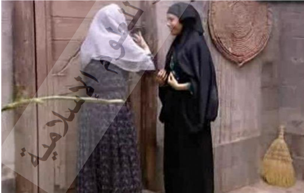
- صورة مستخرجة من المشهد الثالث .

يصور هذا المشهد زيارة شفيقة يت أيتها من أجل الاطمئنان على والدتها، وقد أبرزت اللقطة الموظفة وحركة الكاميرا جانبنا من المكان الذي يدل على الحالة الاجتماعية المزرية التي كانت تعيشها