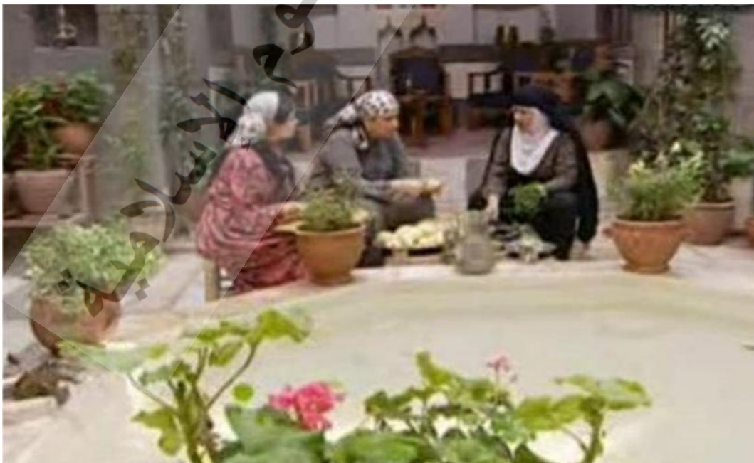
- صورة مستخرجة من المشهد الثالث .