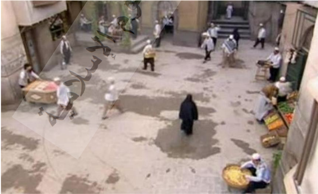
- صورة مستخرجة من المشهد الأول .