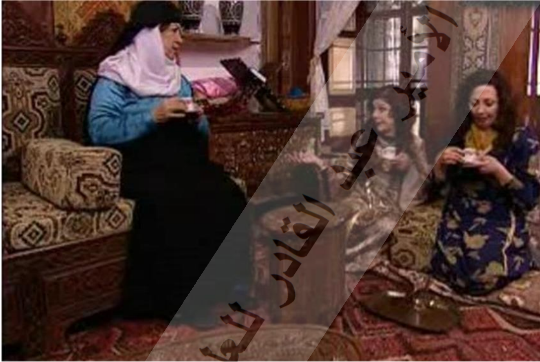
- صورة مستخرجة من المشهد الأول .

صُور هذا المشهد في فضاء داخلي تمثل في غرفة الاستقبال حيث يظهر زيارة أم زكي لبيت سعاد وقد أبرزت اللقطة الموظفة جزءا من ديكور هذه الغرفة والمتمثل في أريكة مصنوعة من الخشب المزخرف المزود بقطع طويلة من الإسفنج المغلف بنسيج مخملي منقوش يعرف باسم دامسكو مزخرف بأشكال مختلفة على مستوى الظهر ومكان الجلوس، أما الجدران فقد كُسيت بالخشب المزخرف بأشكال هندسية ونباتية ومُطعم بألوان مختلفة بجانبها فتحات وضعت فيها مزهريات الزجاج والنحاس للزينة إضافة إلى حامل المصحف كدلالة على المعتقد الديني، و إلى جانب الأريكة توجد قطعة من الإسفنج المغلف للجلوس على الأرض كدلالة على خاصية الجلوس في الأرض التي يتميز بها العرب عن بعض المجتمعات الأخرى وفي الجوانب توجد النوافذ الكبيرة لإدخال الضوء والهواء وقد زينت بستائر بيضاء من المخمل والحرير، أما الأرضية فقد فُرشت بزرابي منقوشة بخطوط وأشكال متداخلة ليدل هذا الديكور بتفاصيله المتنوعة على المكانة الاجتماعية التي تحتلها هذه العائلة، وما