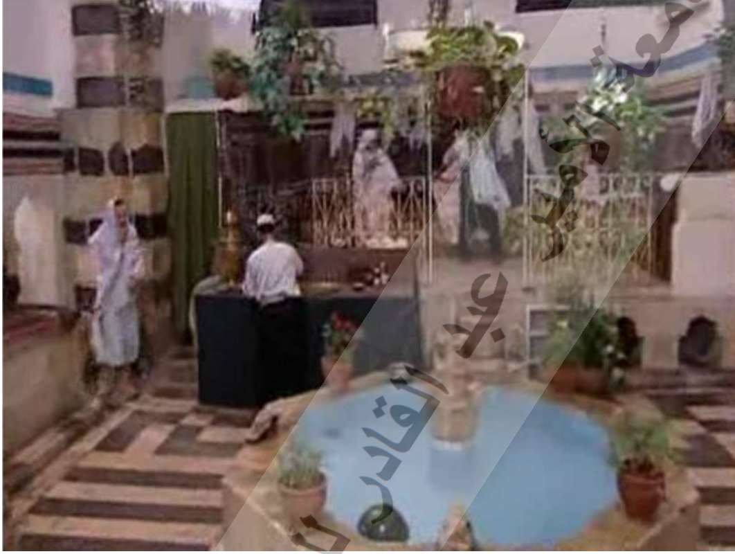
- صورة مستخرجة من المشهد الخامس .

الحارة، فهو الذي لا يذهب للنوم حتى يقوم بجولة في أرجائها بغرض الاطمئنان على هدوئها، كما تدل حراسة الحارة على رفض أهلها لأي تدخل خارجي في شؤونها واعتمادها حكما شعبيا ذاتيا. كـهـ المشـهـد الخامس: