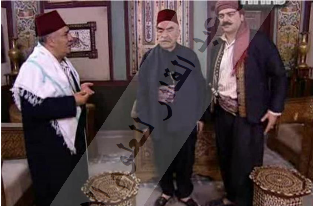
- صورة مستخرجة من المشهد السادس .

وجمعت الجدران بين اللون الأسود والأبيض والأحمر وكلها ألوان تعكس انتماء الشعب السوري، ويتبين من خلال الحوار أن لهذه الحمامات مالك يسمى المعلم، و عامل يسمى الناطور وهو الذي باستضافة الزبائن و الاهتمام بحاجاتهم وينوب عن صاحب الحمام عند غيابه، كما وظف المخرج موسيقى شامية هادئة، إضافة إلى بعض المؤثرات الصوتية الأخرى كأصوات تحريك السكر في كؤوس الشاي و صوت المياه و القبقاب و غيرها لتساهم في خلق الجو العام و إضفاء الفعالية للمشهد، كما ساهمت لغة الحوار في إبراز جمالية العلاقة بين الشخصيات من خلال أمانة عبده و حسن معاملة أبو قاسم له إضافة إلى الاحترام المتبادل بينهما، فلا وجود للتكبر أو احتقار العمال. المشهد السادس: