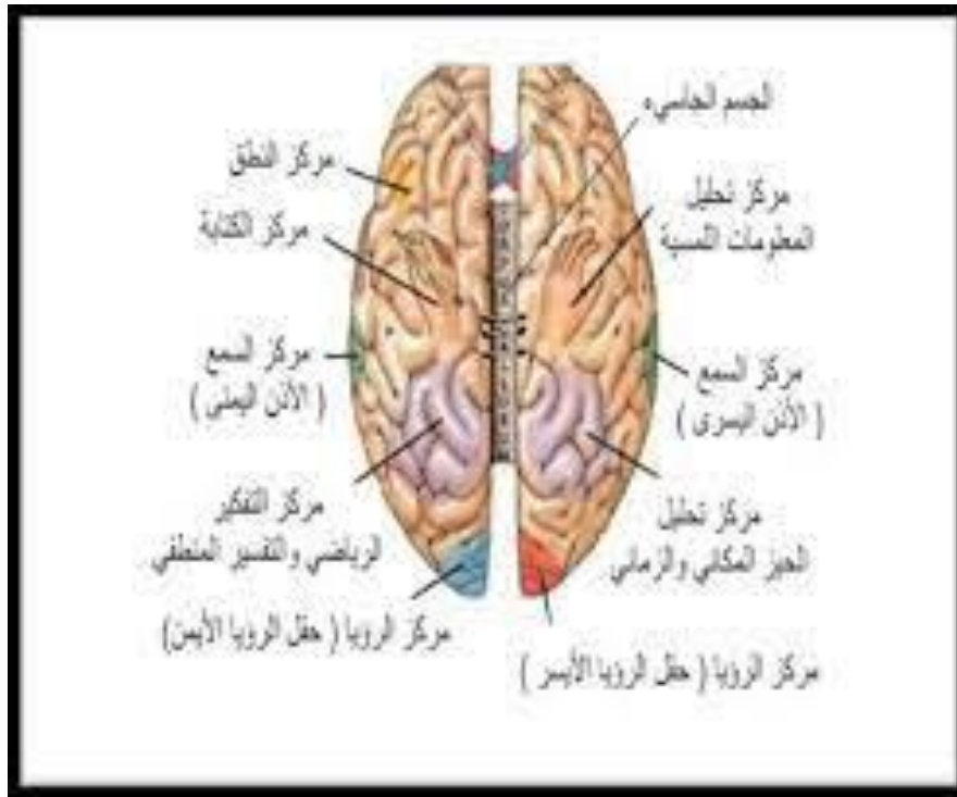
شكل رقم (1): رسم توضيحي لمكونات الدماغ

يقع النصفين الكرتين المخيتين ( الأيمن والأيسر ) في الدماغ، وتغطيهما القشرة الدماغية، وهي المسؤولة عن مهارات التفكير العليا ومن بينها اللغة، وفيها تجري كل العمليات والأنشطة الذهنية كمهارات الفهم، والاستيعاب، والتحليل، وتخزين المعلومات، واسترجاعها. 7 وتجمع الدراسات على أن أغلب وظائف اللغة تقع عادة في النصف الكروي الأيسر في حوالي 85 - 90 % من الأفراد. 8