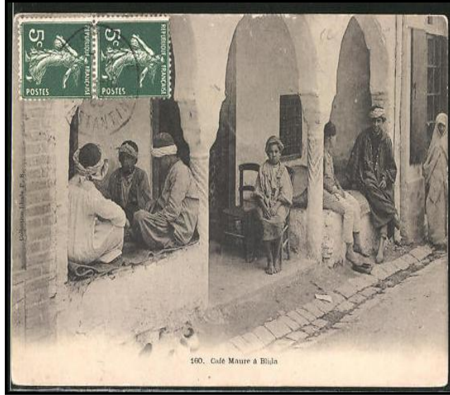
اللوحه 2: تمثل مقهى بمدينة البليدة (carte postale ancienne)

د. رزقي فهيمت ----- عمارة المقاهي الجزائرية من خلال المصادر الكتابية واللوحات الفنية