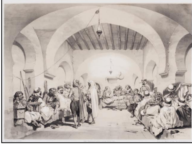
اللوحة 3: تمثل مقهى الديوان بمدينة الجزائر (Berbbrugger)

عمارة المقاهي الجزائرية من خلال المصادر الكتابية واللوحات الفنية ----- د. رزقي فهيمت