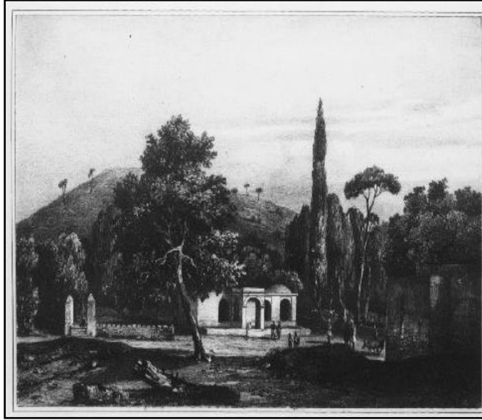
اللوحة 1: تمثل منظر عام لمقهى جزائري ( عن ألبير ديفولكس).

عمارة المقاهي الجزائرية من خلال المصادر الكتابية واللوحات الفنية ----- د. رزقي فهيمت