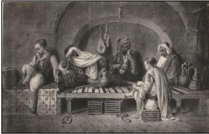
اللوحة 4: تمثل مقهى بمدينة الجزائر (Lessor et Wydi)