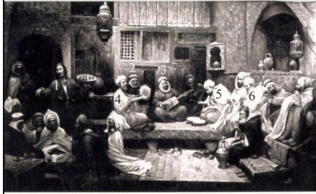
اللوحة 5: تمثل مقهى بمدينة قسنطينة (carte postale ancienne).